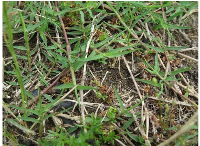
よく見ると雑草等の間に種子があります。