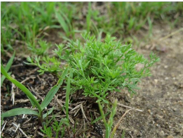
高さ5cm程度の比較的小さな草です。

メリケントキンソウは外来植物 がいらいしょくぶつ です。靴底 くつそこ についた 種子 しゅし は落 お として、外 そと に拡 ひろ げないようにしてください。